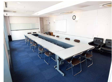
テーブルやイスは用途によって自由に配置可能です。

<禁止事項> ■ 楽器の演奏など大きな音を出す行為や、強いにおいを発する行為 ■ 施設内の壁・柱等への貼り紙・釘打ち・セロテープ貼り ■ 公序・良俗に反する行為