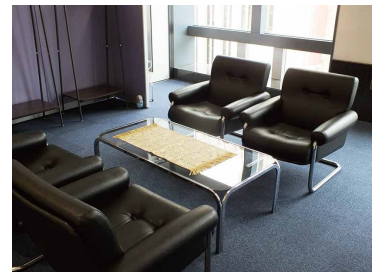
4 人掛けの応接セットもご用意しております。

スカイルームのご見学や空き状況などお気軽に担当者までお問い合わせください。担当/大丸藤井セントラル 販売支援課