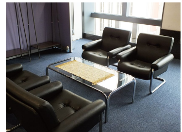
4人掛けの応接セットもご用意しております。

スカイルームのご見学や空き状況などお気軽に担当者までお問い合わせください。担当/大丸藤井セントラル 販売支援課