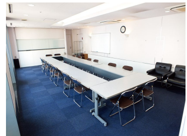
テーブルやイスは用途によって自由に配置可能です。

<禁止事項> ■ 楽器の演奏など大きな音を出す行為や、強いにおいを発する行為 ■ 施設内の壁・柱等への貼り紙・釘打ち・セロテープ貼り ■ 公序・良俗に反する行為